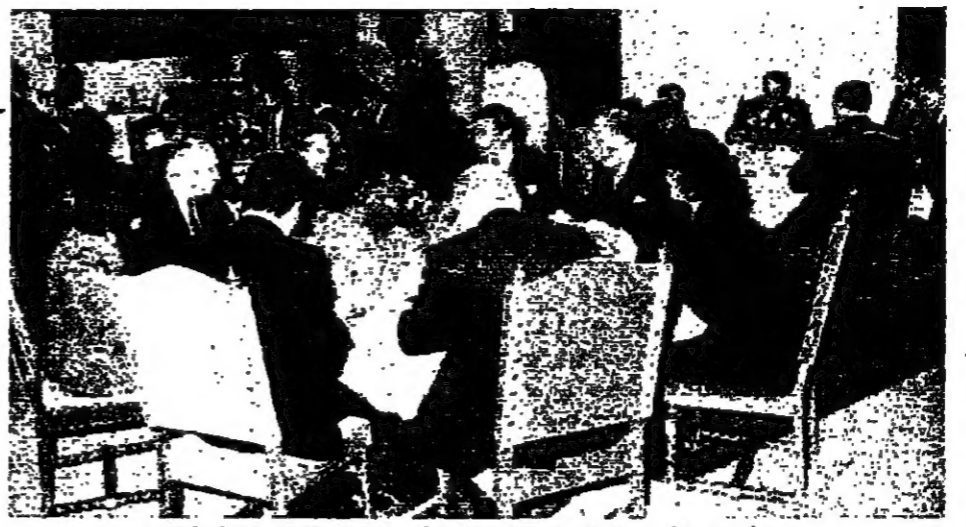
حوار بين كرامي والسفير الأمريكي خلال مأدبة الجليل للسلام الديبلوماسي

يقول مسؤول لبناني بارز، إن اللبنانيين يتصرفون وكان مصر العلم سيقول اليوم الاثنين في جنيف والقاهرة، على رغم المسافة الشاسعة الفاصلة بين اللاذقية السورية التي شهدت أول مؤتمر للحوار اللبناني، وكثير راس على السطح اللبناني، والذي تجري فواره الجولة الثانية عشرة من المفاوضات العسكرية اللبنانية - الإسرائيلية. ويضيف المسؤول اللبناني أن لا مبرر لعلم سيقول خلال لقاءه شولتز وعروميكوف، ولا مبرر لبناني سيجتمع في محادثات دمشق، كما تكرر في مؤتمر الخارجية الإسرائيلي مع نظيره السوري في جنيف، لخصم مستقبلي الصراع العربي بين يدي الرئيس ريفان والرئيس شولتز، وكثير هذه القصة إن تكون حلول للصراع الذي يربط بينه وبينه. إن لبنان والشعب اللبناني - فمن تكون الإحاطة من حقائق الكرو والفر التي تجأ إليها إسرائيل للضغط على لبنان، بغية القول بغير شروط والحلول الإسرائيلية.